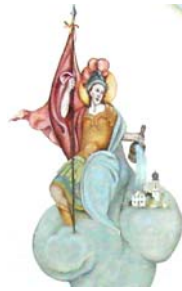
Heiliger St. Florian (Gemälde am Gerätehaus der FF Kleinalfalterbach)