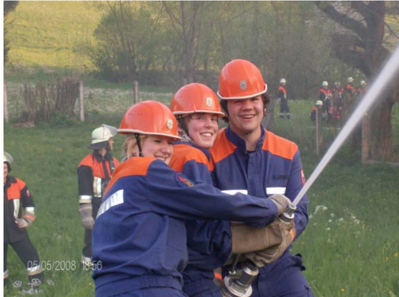
(Einsatzübung der Jugendfeuerwehr Deining)

Die Atemschutzgeräteträger absolvierten wieder die alljährlich erforderliche Wiederholungsübung in der Übungsanlage in Neumarkt (Belastungstest und Kriechstrecke).